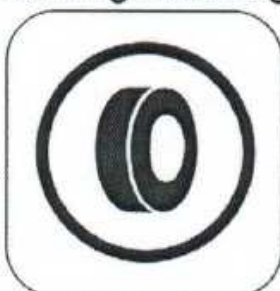
Begin of Tyre Marking/Checking

Colour of Control Area Entry: YELLOW Colour of Control: BLUE