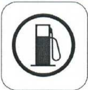
Begin of Refuel Zone

Colour of Control Area Entry: YELLOW Colour of Control: RED