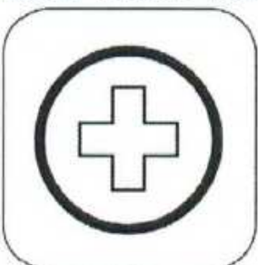
Medical Vehicle Point

Colour of Control Area Entry: YELLOW Colour of Control: BLUE