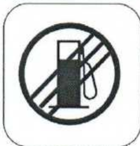
End of Refuel Zone