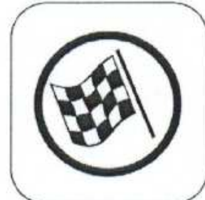
Flying Finish Line

Colour of Control Area Entry: YELLOW Colour of Control: RED