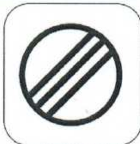
End of Control Area