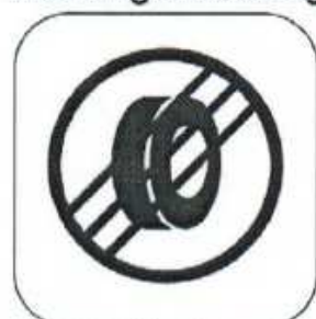
End of Tyre Marking/Checking